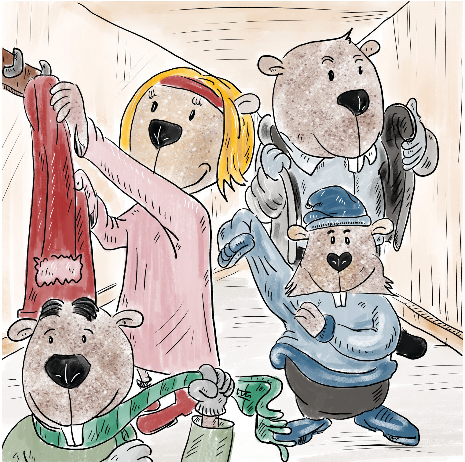
Ο Νέοτορας και η οικογένειά του βάζουν χειμωνιάτικα ρούχα, για να πάνε στο χιονισμένο βουνό.