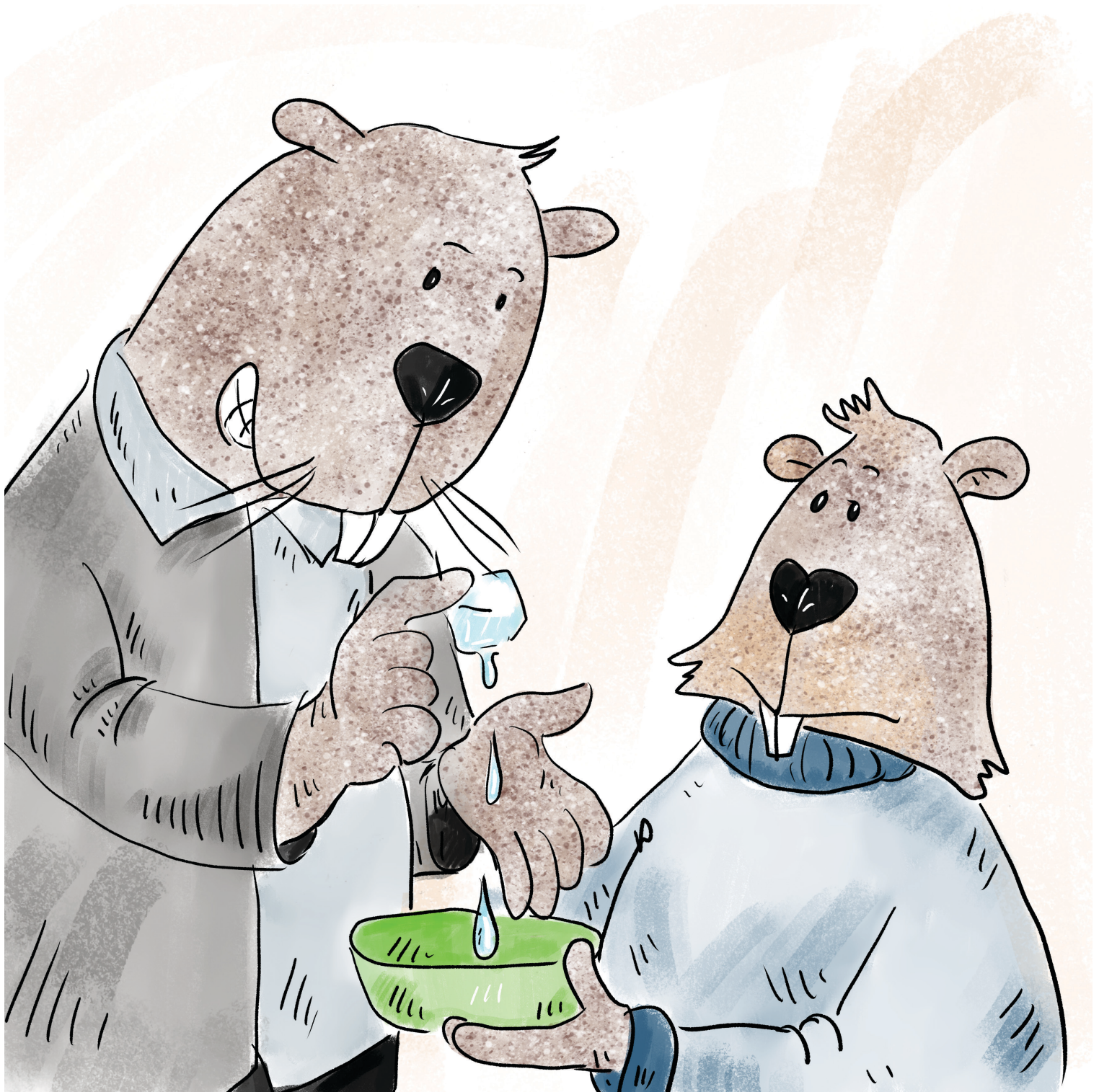
Ο μπαμπάς του Νέστορα βγάζει ένα παγάκι από το ψυγείο.