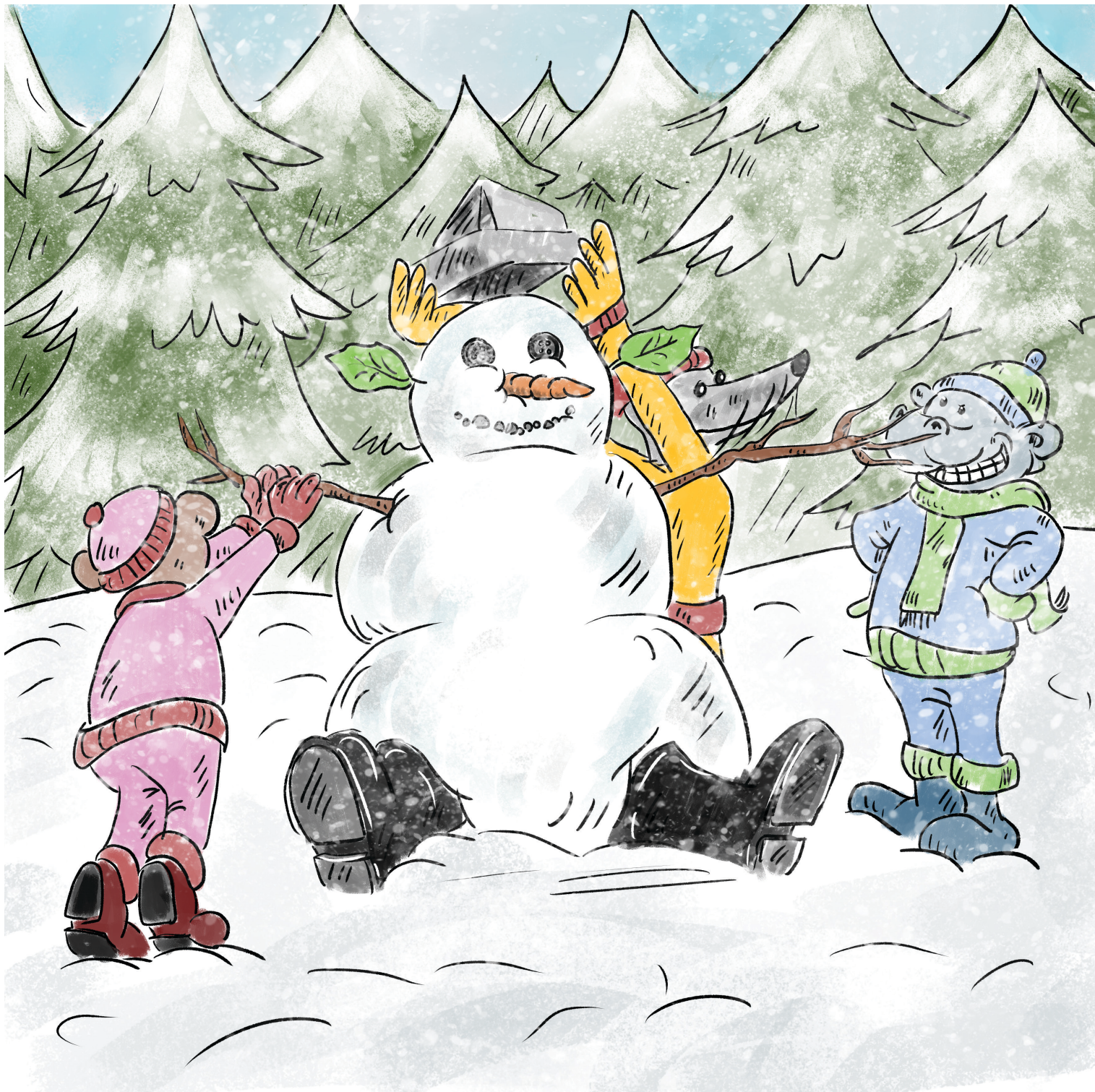
Ο Νέστορας παρακολουθεί κάποια παιδιά που φτιάχνουν έναν μεγάλο και χοντρό χιονάνθρωπο.