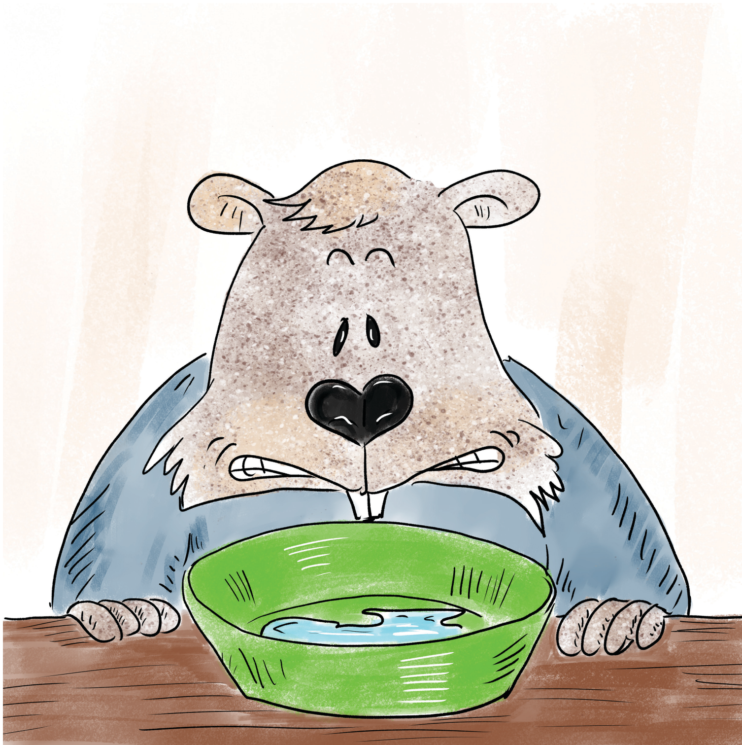
Ο Νέστορας βλέπει το παγάκι του να γίνεται νερό: