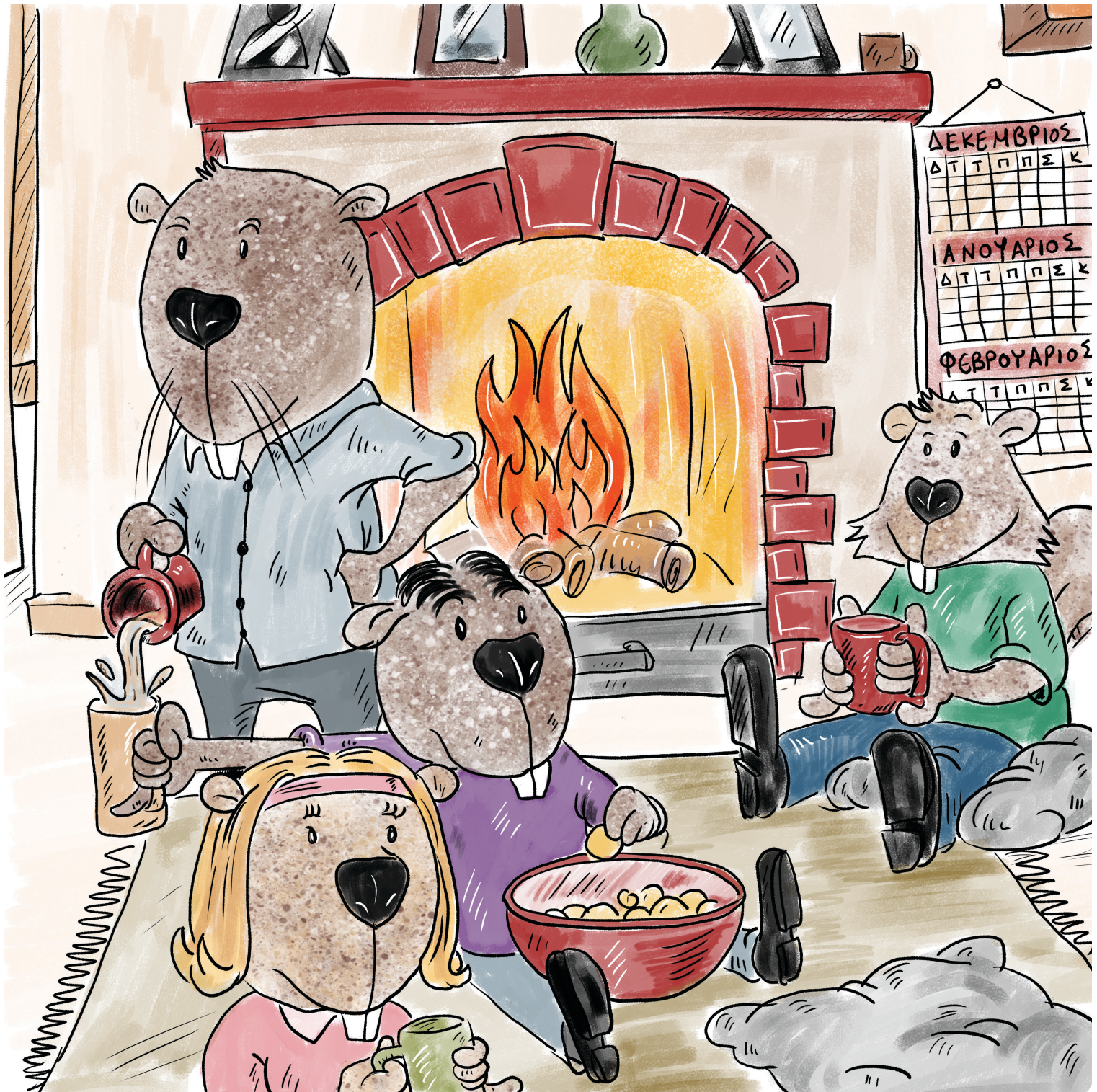
Η οικογένεια του Νέστορα είναι μαζεμένη γύρω από το τζάκι πίνοντας ζεστή σοκολάτα.