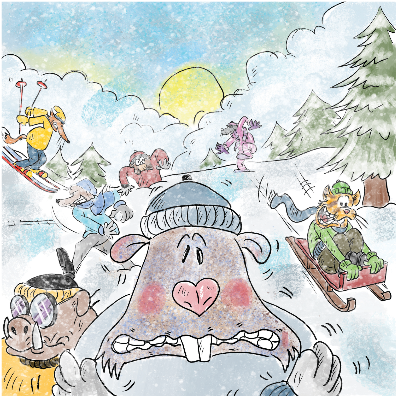
Στο βουνό, κόσμος μαζεμένος απολαμβάνει το χιονισμένο τοπίο.