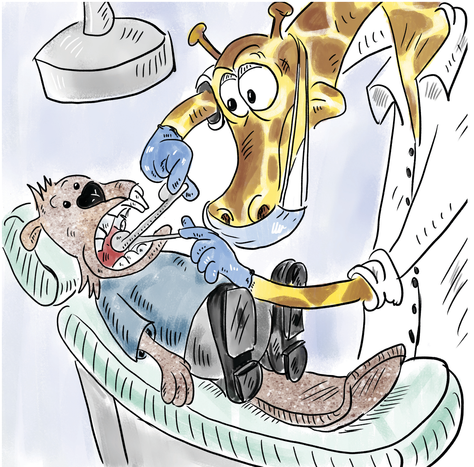
Ο Νέστορας επισκέπτεται την οδοντίατρο.