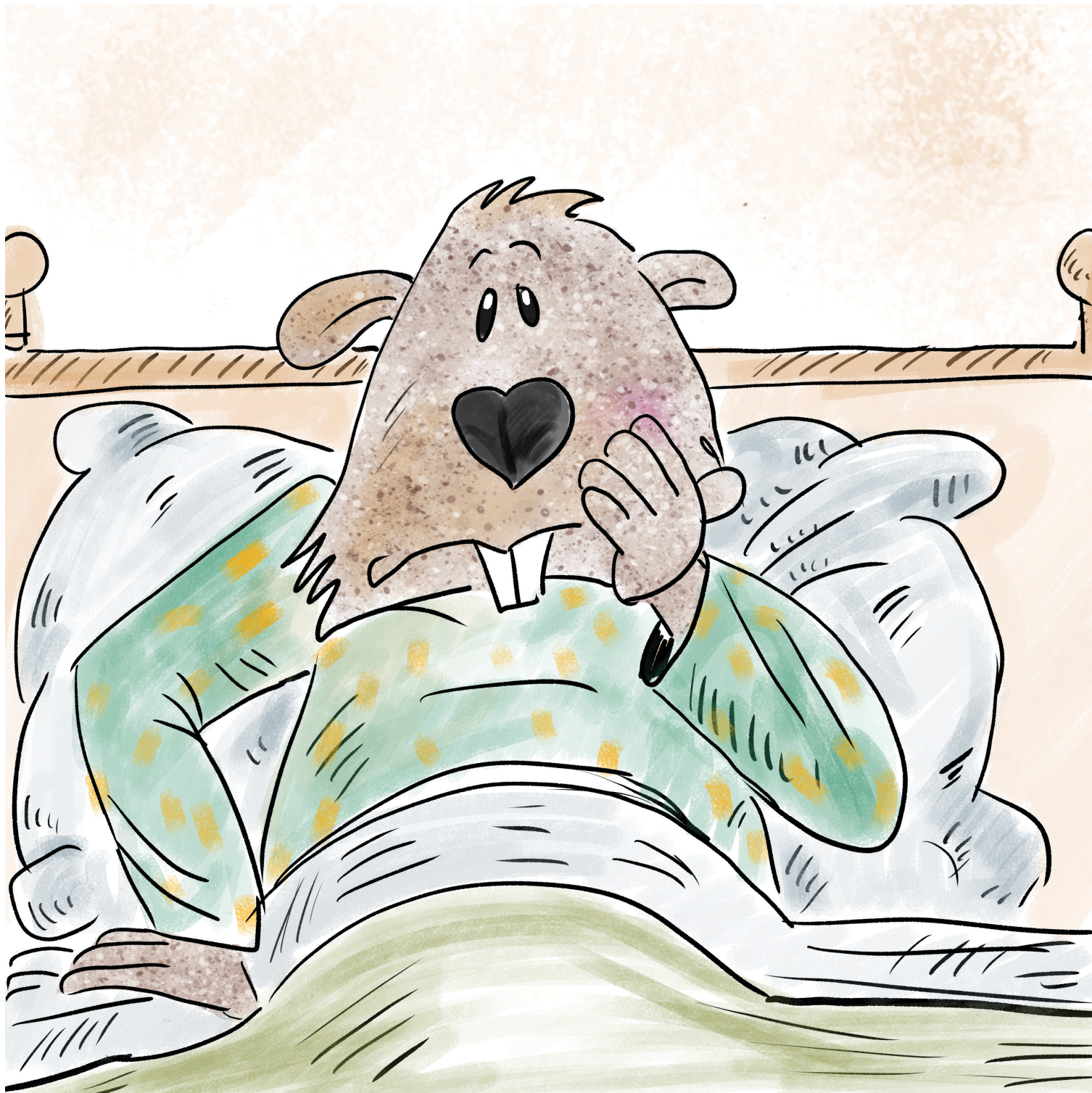
Ο Νέοτορας έχει πονόδοντο.