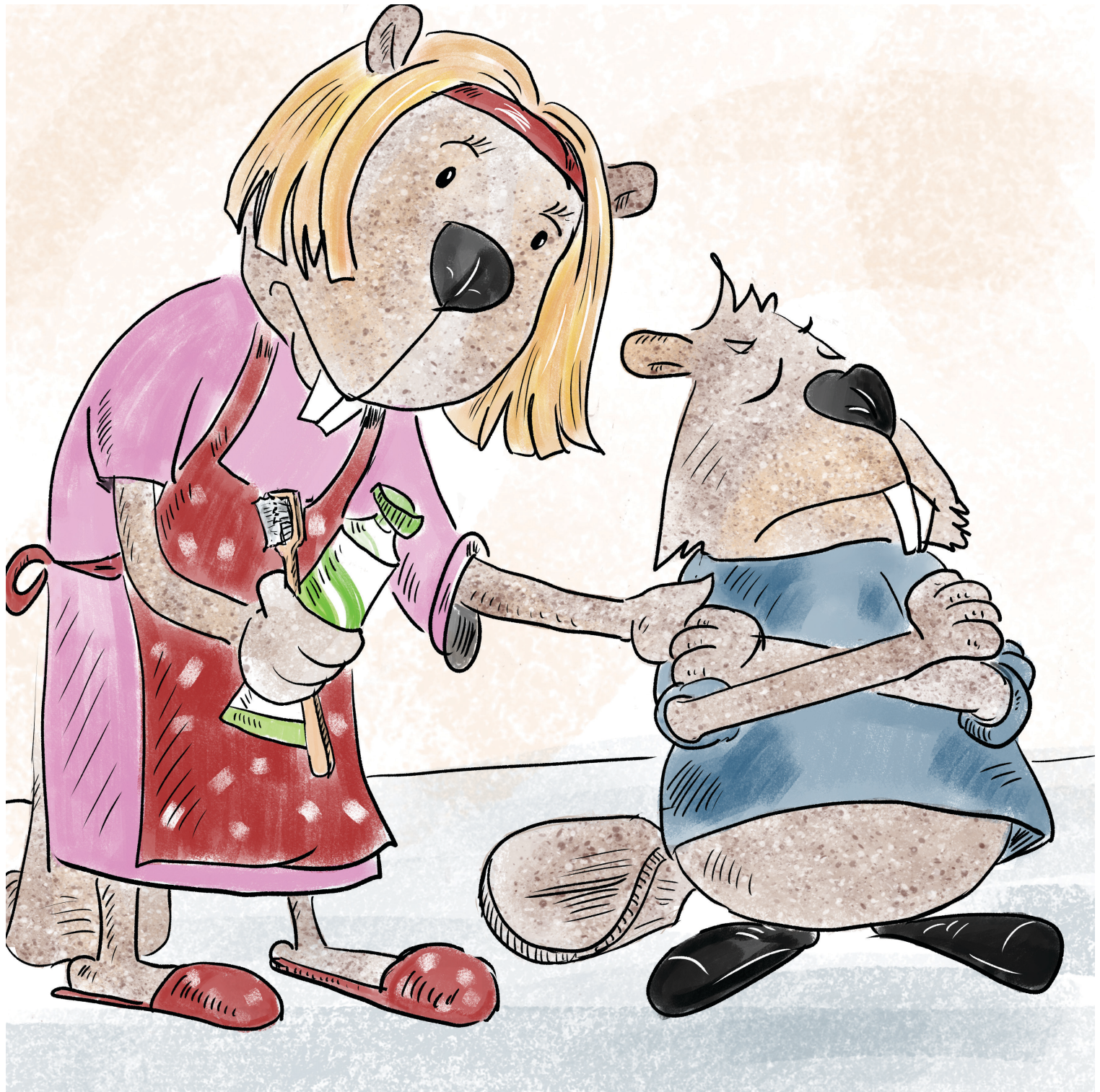
Ο Νέστορας δεν θέλει να πλύνει τα δόντια του το βράδυ.