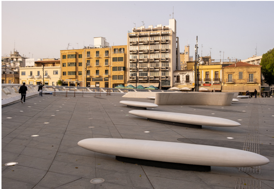
η Λευκωσία: πλατεία Ελευθερίας