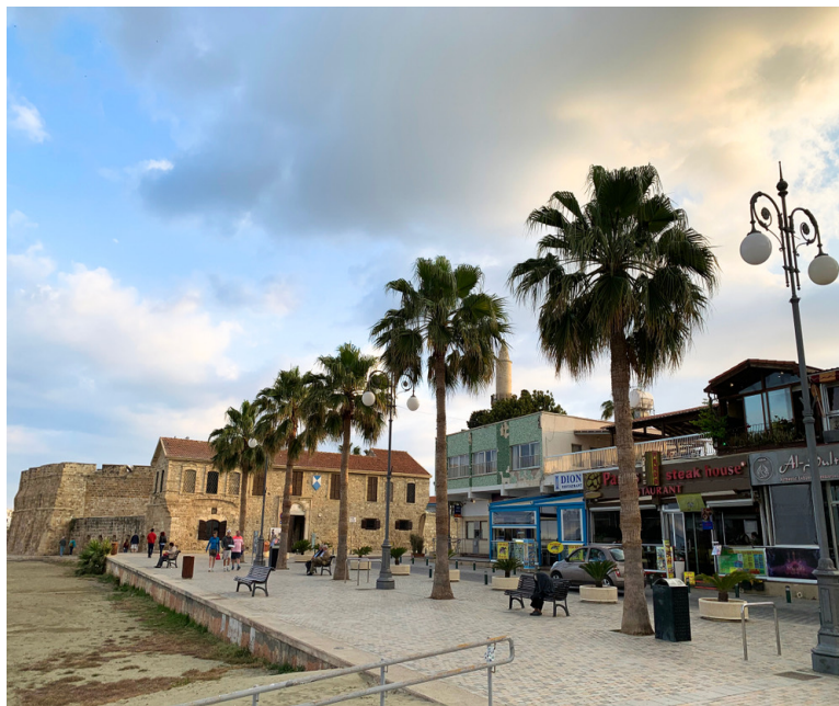
η Λάρνακα: οι Φοινικούδες