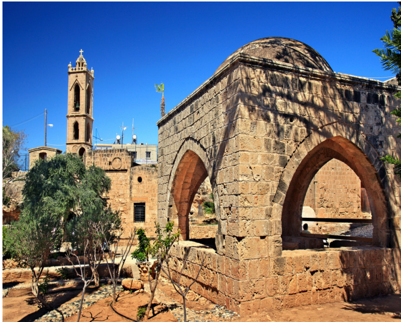
η Αμμόχωστος: μοναστήρι Αγίας Νάπας